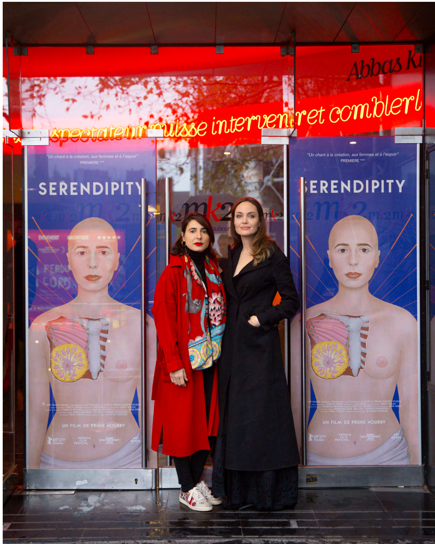
Prune Nourry et Angelina Jolie à la projection privée mk2 Beaubourg à Paris le 20 octobre 2019.